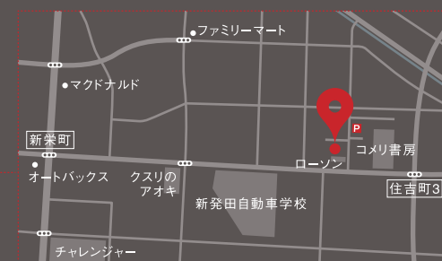
※会場近くに臨時駐車場をご用意しております。